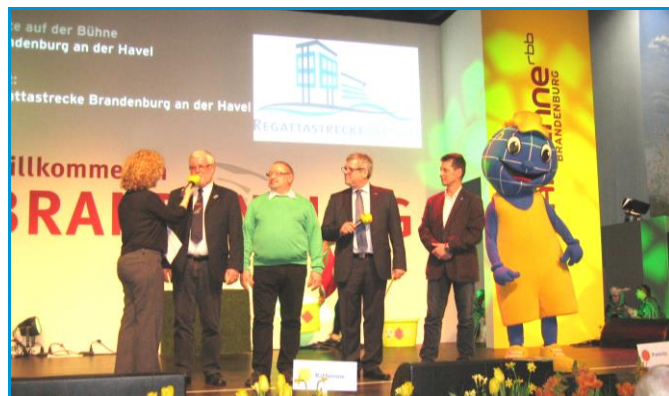
Vielleicht klappt es so wie 2015 auch Anfang 2016 bei der IGW wieder mit einem Auftritt auf der Antenne-Brandenburg-Bühne.

diesbezüglich mit der Leiterin der Brandenburger Touristinformation bereits Ende Oktober 2015 statt.